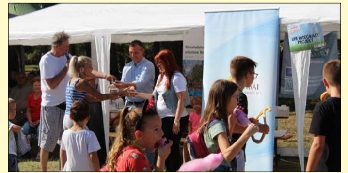
A programot elsősorban a családokra építették