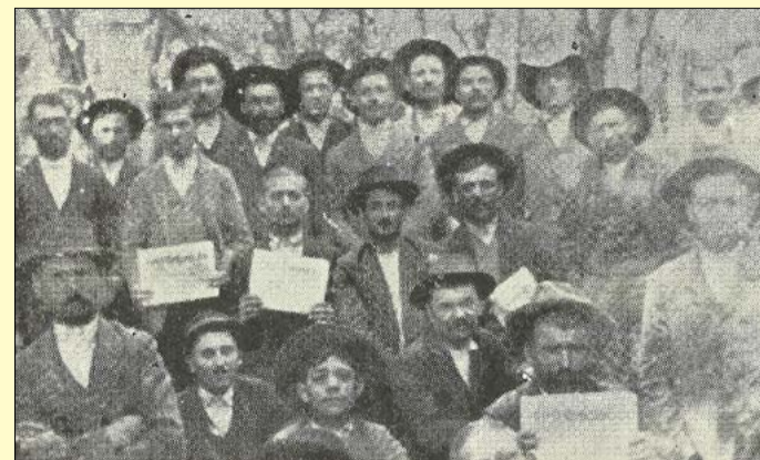
Építőipari munkások a ligeti sztrájkanyán

Békéscsaba iparosodása a 20. században a fellendülés szakaszába érkezett. A textil-, a bútort- és a téglapipar megjelenése a munkások létszámát növelte. A hosszú munkaidő, a nyomott bérek és a szociális körülmények már a 20-as években elégedetlenséget váltottak ki. Mindezek a várost a bérharcok, sztrájkok és tüntetések színterévé tették.